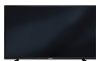
49 GUB 9787 Monaco 123 cm (49") LCD-TV mit LED-Technik schwarz / B