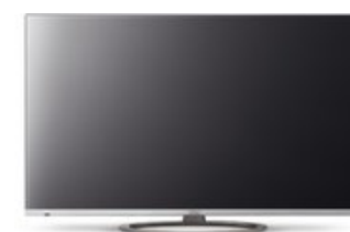
Clarea 47 Media 120 cm (47") 3D-LCD-TV mit LED-Technik