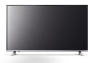
Pureo 49 123 cm (49") LCD-TV mit LED-Technik schwarz / A+