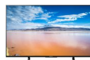
KD-49XE8005 123 cm (49") LCD-TV mit LED-Technik schwarz / A