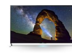
KD-55X9005C 139 cm (55") 3D LCD-TV mit LED-Technik schwarz / B